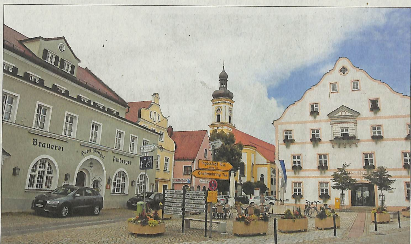
Gebraut wird nicht mehr in Kösching, aber im „Brauereigasthof Amberger“ am Köschinger Marktplatz (Bild rechts) gibt es noch das früher dort hergestellte Amberger Hell. Nur wenige Meter entfernt, neben der Kirche, ist im Marktuseum die Sonderausstellung „Der alte Bräu“ zu sehen, In deren Rahmen auch alte Bierkrüge gezeigt werden.